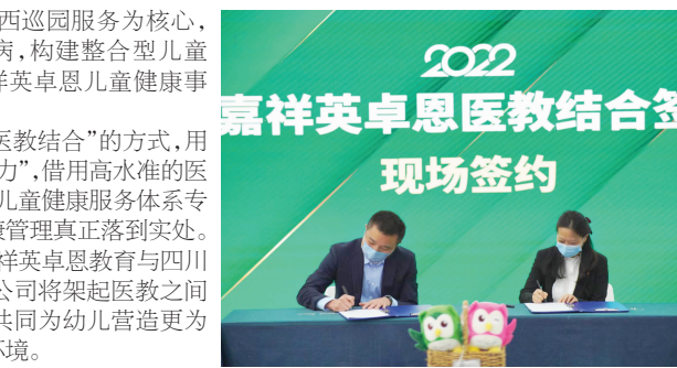
2022 嘉祥英卓恩医教结合签约仪式现场签约

本报讯 9月30日,嘉祥英卓恩教育与四川大学华西第二医院全资子公司四川华西妇幼健康科技有限公司共同举行了华西·嘉祥英卓恩医教结合签约仪式,该合作旨在通过医教结合的方式,丰富幼儿家长科学育儿知识,提升幼儿园科学育儿和膳食搭配水平;以及建立绿色健康咨询通道,共同保障儿童健康。 双方将通过四项举措落实“医教结合”理念:第一,通过专家讲座,帮助家长培养科学健康生活方式,树立健康管理理念;第二,赋能幼儿园保健老师,提高儿童健康管理能力;第三,为入园时段提供突发急症绿色通道;第四,以华西巡回服务为核心,早筛查、早预防儿童疾病,构建整合型儿童健康服务体系,推进嘉祥英卓恩儿童健康事业高质量发展。 未来,英卓恩将以“医教结合”的方式,用好华西专家团队这股“外力”,借用高水平医疗资源和技术,积极推进儿童健康服务体系专业化、常态化,将儿童健康管理真正落到实处。本次合作协议签订后,嘉祥英卓恩教育与四川大学华西妇幼健康科技有限公司将架起医教之间的桥梁,形成教育合力,共同为幼儿营造更为健康、安全、快乐的成长环境。