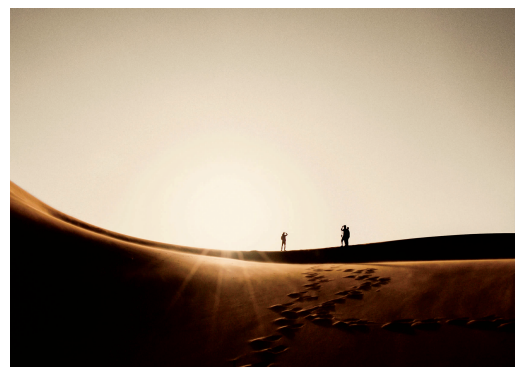
大漠晨曦 嘉祥国际课程班 Miky LI 摄

么?我坚信,绝对并非如此。我们感受过、体验过、走过,我们便可以坚定地,用我们的脚印书写的风景,用我们的汗水浸润的蓝图,才是最美的!没有“为何”,只因我们走过,才明白。 “我想左肩有你,右肩微笑……我想一个眼神,就到老。”低沉的歌声又将我拉回来,我不由得得失,忽然觉得豁然开朗。人生何处无风景?走过,才明白! (指导老师 黄君艳)