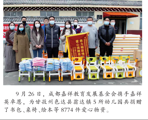
9月26日,成都嘉祥教育发展基金会携手嘉祥集团,为甘孜州色达县达真镇5所幼儿园共捐赠了书包、桌椅、绘本等8774件爱心物资。

7月1-3日,清华大学“强基计划”复试在锦江嘉祥举行,来自全国各地1500余名高三优秀学生参考。 7月5日,2022年锦江嘉祥国际高中课程班取得IB项目总分40以上学生占比20%(满分45),AP项目单科满分学生占比高达80%的好成绩。 7月初,在第三十二届全国中学生应用物理竞赛中,成华嘉祥初二、初三学生获省级、全国一二三等奖。 7月,自贡嘉祥相继被评为自贡市两新组织“双强六好”党建示范单位、自贡市“先进基层党组织”,自贡市教育体育系统“先进基层党组织”。 7月22日,在第十六届中国国际合唱艺术节中,成华嘉祥重声合唱团荣获“重声组二级团”称号。 7月,成华嘉祥男子、女子