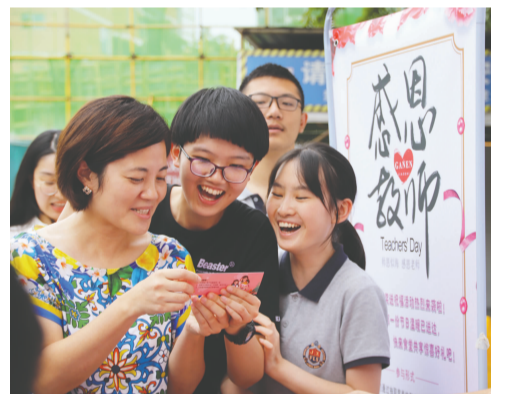
9月10日,廊桥嘉祥组织各校食堂开展“感恩教师”抽奖活动,用鲜花和酸奶,为每位教师送上诚挚的节日祝福。(朱怡霖)