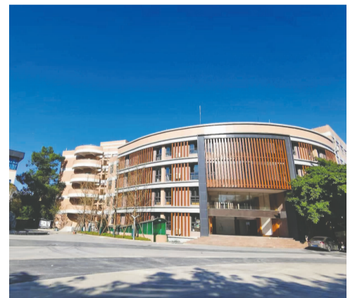
利用暑期,嘉祥房产公司对锦江嘉祥小学、成华嘉祥二仙桥校区进行了局部或大规模的升级改造;对成华嘉祥国际校区游泳馆、屋顶网球场和看台膜结构进行了新建和改造,3个校区的校园面貌焕然一新。(孙丽君)

映在全市数学优质课展评活动中分别获一、二等奖;曼杰、谢丹、张恒在达州市体育教师基本功大赛中获一等奖。