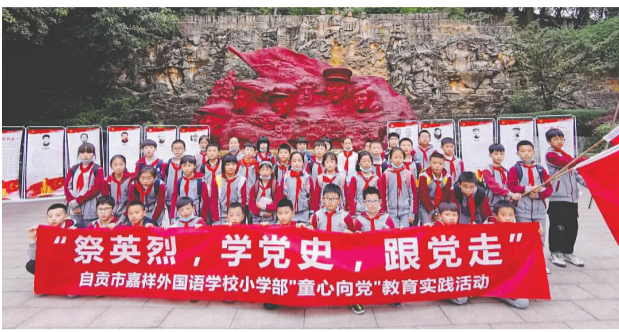
“祭英烈，学党史，跟党走” 自贡市嘉祥外国语学校小学部“童心向党”教育实践活动

班会教育和远足祭奠两部分。 3月29日，全校各年级各班开展了“祭英烈、学党史、跟党走”的主题班会活动，在各位班主任的带领下，孩子们了解党史、缅怀英烈。4月1日下午，四五年级的学生穿着整洁的校服，佩戴着鲜艳的红领巾，在学校德育处、大队部的组织下，前往自贡市烈士陵园进行了清明祭扫活动。少先队员们高举右手庄严宣誓，铿锵有力的誓言响彻陵园上空，表达了他们为共产主义事业接班人的坚定信念。 （唐梦雪） 又讯 4月15日上午，中共嘉祥成华党支部在五楼圆桌会议室召开支委（扩大）会议，商讨完善支部“奋斗百年路，启航新征程”主题教育实施方案。校党支部书记、执行校长朱海燕宣讲了《全区教育系统开展党史学习教育的实施意见》，传达了成华区教育局党委和成华区教育系统的会议精神，进一步明确了我校关于庆祝建党100周年主题教育的要求，并建议政史地教师充分发挥学科的党史育人作用，将党史知识融入学科教学中，列入教育教学计划，强调三个学科的跨学科整合，落实立德树人的根本任务。 （董恒旭 秦瑶 郑文霞）