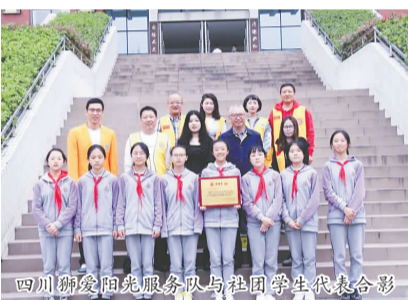
四川狮爱阳光服务队与社团学生代表合影