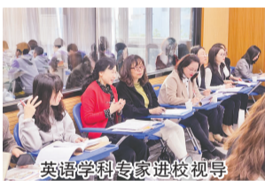
英语学科专家进校视导