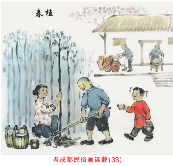
老成都民俗画连载(33)