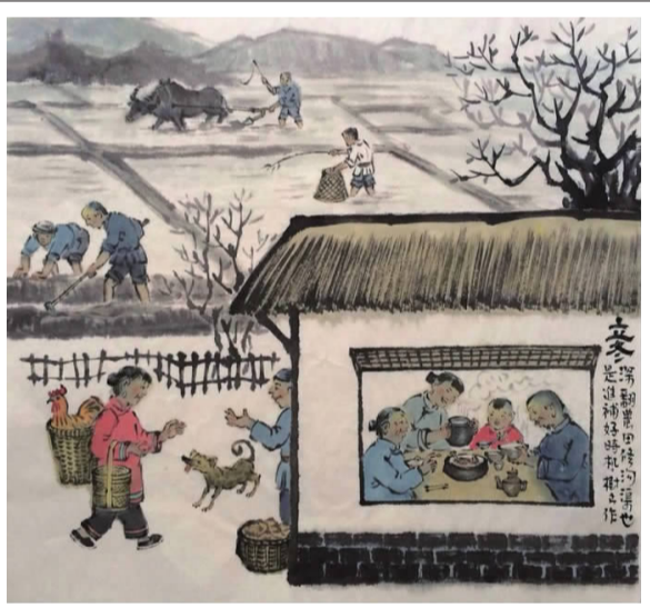
老成都民俗画连载(32)