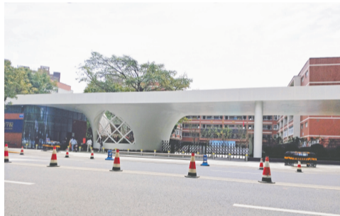
嘉祥外国语新校门落成

39名教代会成员、学校中层管理干部参会。教代会是充分发挥全体教职工智慧和凝聚教职工力量的一个重要载体,教代会的召开将进一步落实教职工参与学校民主管理和民主监督权力,加强教代会制度化、规范化工作,全面落实教代会各项职权,不断推进教职工民主管理工作。(钟劭霖)