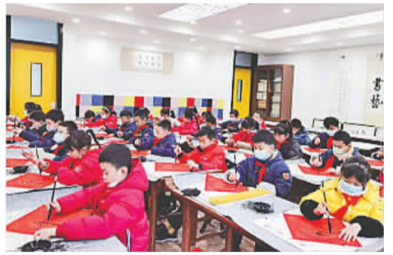
▲2020年12月底,都江堰嘉祥举办了“嘉都墨韵,喜迎牛年”春联书法展,图为孩子们积极参与书写。