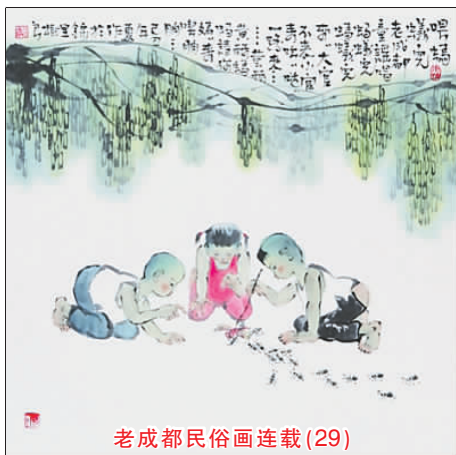
老成都民俗画连载(29)

这块印记至今一直提醒着我，一位真正的教师，应站在儿童的角度，真诚地面对、理解和处理好他们成长中所发生的一切，哪怕所发生的是令自己不开心和不愿看到的。