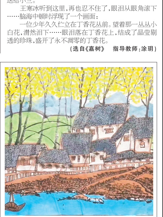
成都嘉祥三年级(1)班 陈姝狄 绘