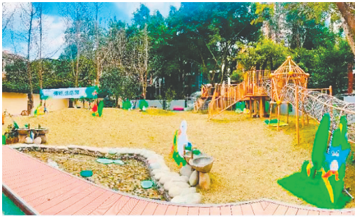
为创设更好的室内生活空间,2021年底,嘉祥英卓思启动对锦江园的生态园、温江区的体能室和入园道班房的改造。图为改造后的锦江园生态园。